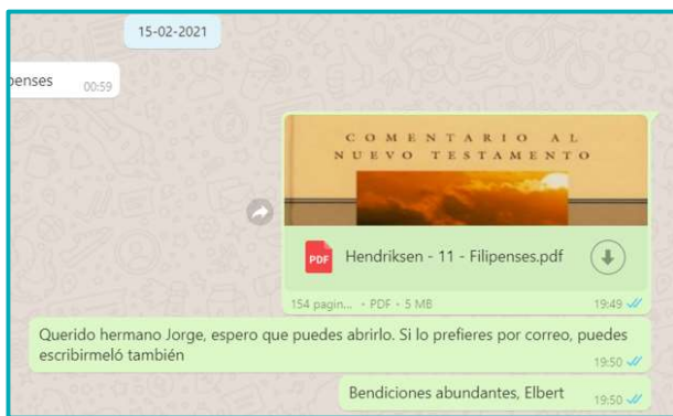
DIGITAAL VERZENDEN VAN LECTUUR

Contacten Helaas kon gedurende het hele jaar geen reis worden ondernomen. Religieuze visa worden niet afgegeven en mensen die het land binnenkomen gaan onherroepelijk een week in quarantaine, waarna ze worden getest. We hebben geïnvesteerd in videobelmomenten met voorgangers, waardoor we vaak heel goed konden communiceren. Dit middel versterkt duidelijk de band, zowel met voorgangers die we nog nooit werkelijk hebben ontmoet alsook met hen die we op Cuba hebben kunnen bezoeken in het verleden. Een digitale bijeenkomst met zo'n 10 predikanten tegelijk via Zoom was een historisch moment voor SEZ. Het was de eerste keer dat we dit meemaakten. Nu weten we dat dit ook tot de mogelijkheden behoort.