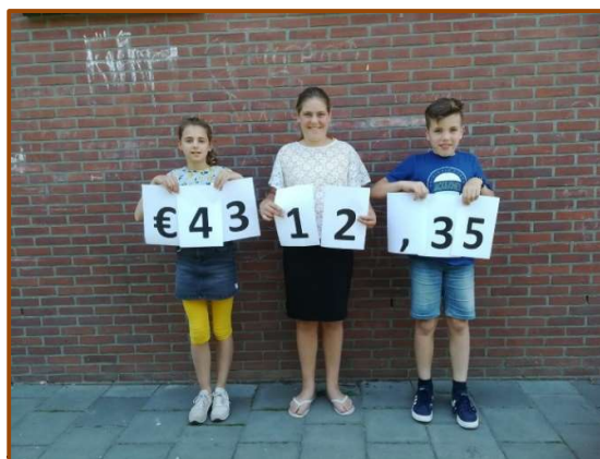
SCHOOL MET DE BIJBEL STREEFKERK VOERT ACTIE VOOR SEZ

De SEZ ontving van verschillende scholen zendingsgeld, gaf op twee scholen voorlichting en enkele scholen voerden actie voor de SEZ.