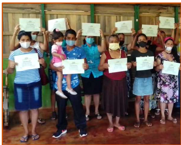
CURSISTEN IN MANDINGA ONTVANGEN EEN BIJBELCURSUSDIPLOMA.

Geliefde broeder, afgelopen zaterdag (9 januari 2021) heb ik 189 diploma's opgestuurd naar cursisten die een cursus hebben afgerond van de Cursos Biblicos Eben Ezer eind 2020.