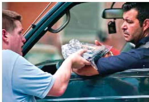
Evangelisatie onder moslims in Zuid-Spaanse havens

Ieder jaar evangeliseren protestantse kerken in Zuid-Spanje onder een heel aparte doelgroep: mensen uit Noord-Afrikaanse landen zoals Marokko die ooit naar West-Europa emigreerden om daar werk te zoeken, maar 's zomers met hun gezin teruggaan naar Afrika voor familiebezoek. Na lange autoritten door Frankrijk en Spanje komen ze aan in Zuid-Spaanse havensteden. Van daar uit is de oversteek naar Afrika betrekkelijk snel gemaakt. Afgelopen jaar werden met deze Operación Tránsito (Operatie Doortocht) meer dan 25.000 personen bereikt, in overgrote meerderheid moslims. Het Spaans Bijbelgenootschap stelt tweetalige Bijbels, lectuur en USB-sticks met Bijbels materiaal beschikbaar. 🗨️