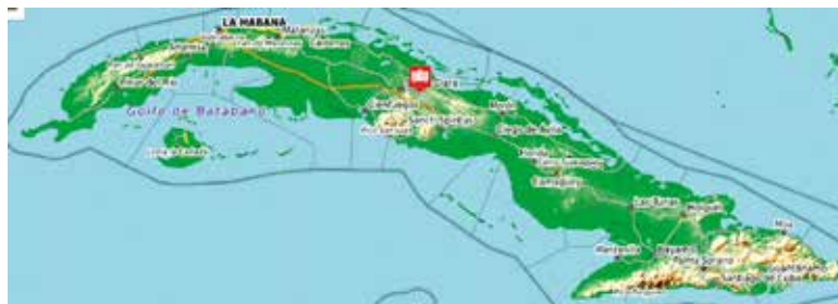
De positie van de drukkerij in Cuba, centraal in het land

Het is onze hoop en verwachting dat dit reformatoorsch-puriteins gedachtengoed tot zegen zal zijn voor velen in Cuba. Wij vragen uw voorbede voor dit project. ☛