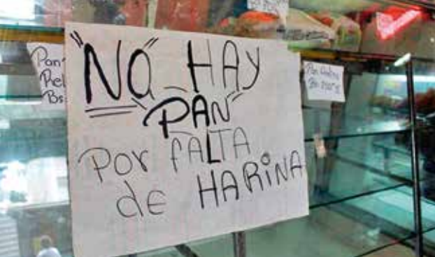
Er is geen brood door gebrek aan meel

bediende in een bovenruimte boven een woning het Woord voor slechts achttien toehoorders. Het deed ons erg goed om zelfs bevindelijke lijnen in de prediking te horen. We voelden hier duidelijk de eenheid van belijden. De hele dienst had een reformatorisch karakter.