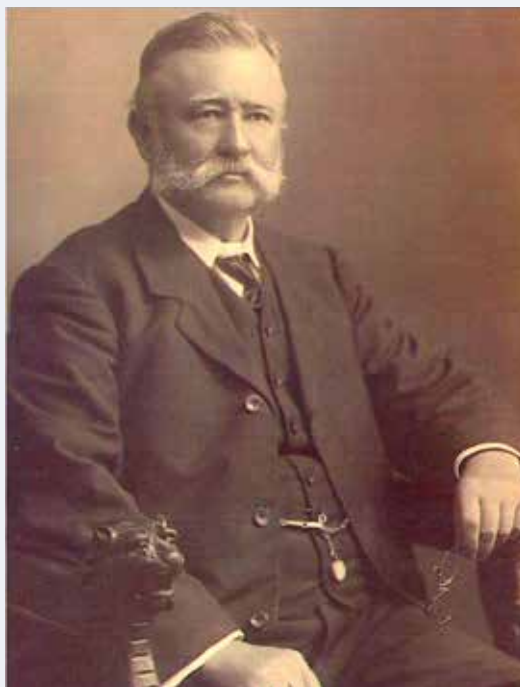
James Thomson

In die vroege 19 e eeuw, waarin het zendingsbesef echt tot ontwaken kwam, vooral in Groot-Brittannië,