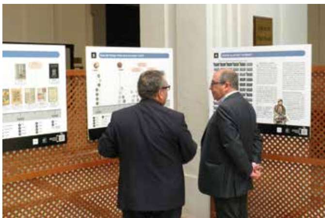
De Berenbijbel-tentoonstelling in Sevilla maakte de tongen los.

De foto's en het feitenoverzicht op deze pagina vertellen meer over de 'Berenbijbel'.