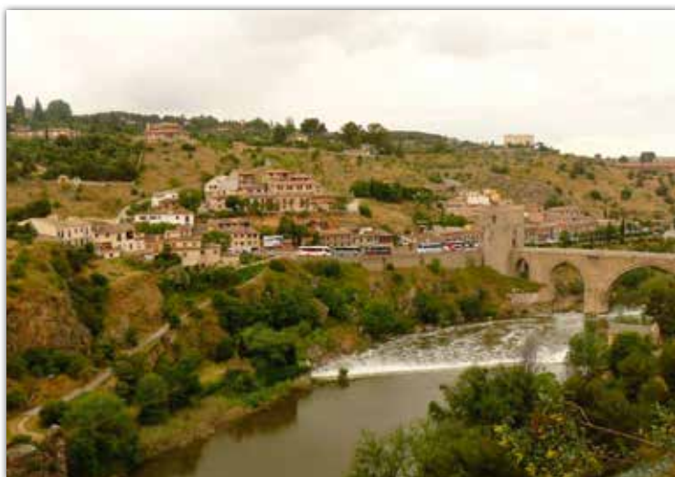
Blik op de rivier de Taag. De foto is genomen vanuit de hooggelegen Spaanse stad Toledo, waar de Taag zich omheen slingert.

Als u (oude) boeken en cd's kwijt wilt, kunt u contact opnemen met onze voorlichter D.C. de Korte, dcdekorte@gmail.com (tel. 078 613 69 67).