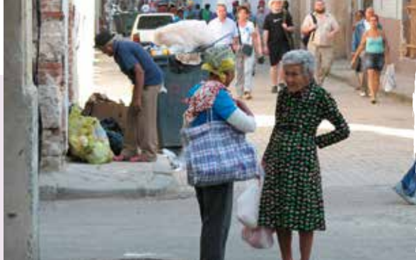
Ouderen zoeken hun kost bij elkaar, ook in de vuilnisbak

Vroeger was tachtig procent van de Cubaanse bevolking op papier Rooms. Tijdens de Revolutieperiode onder leiding van Fidel Castro was godsdienst verboden en was Cuba een atheïstische staat. Inmiddels geeft de nieuwe grondwetziening de Cubaan wat meer godsdienstvrijheid. Maar... deze godsdienstvrijheid geldt alleen voor de door de so-