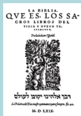
Titelblad van de Berenbijbel uit 1569.

latere revisies: 1862, 1909, 1960 (de meest gebruikte editie in Spanje en Latijns-Amerika) en 1995. Revisie door TBS: NT + Psalmen/Spreuken (2017) en OT (in voorbereiding)