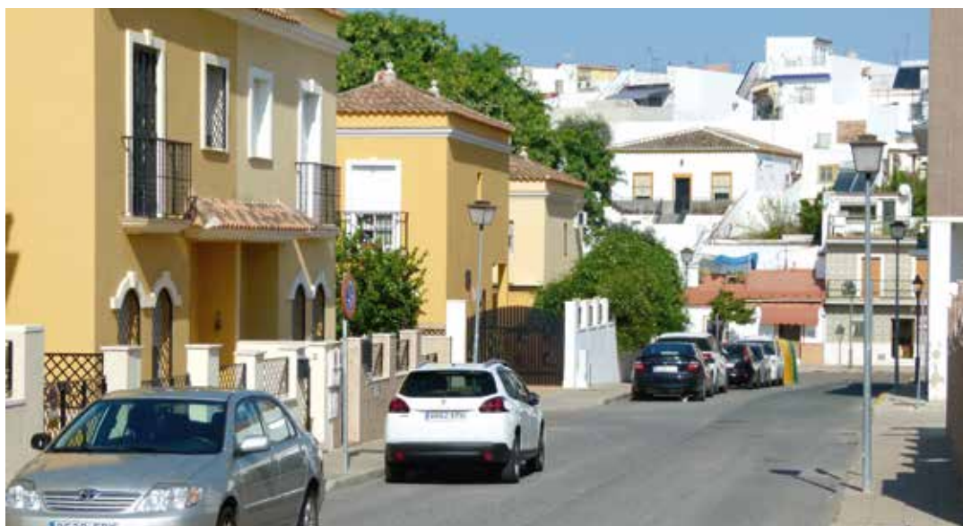
In het dorp Santiponce is tegenover het klooster zowel een Reinastraat (foto) als een Valerastraat te vinden.