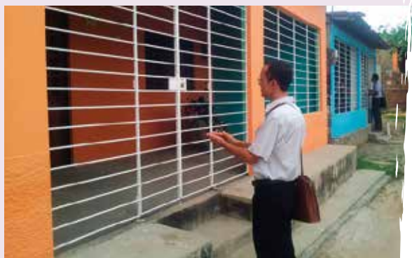
Jehova's Getuigen zeer actief in Cuba

cialistische staat erkende godsdiensten. Er zit een adder onder het gras: opnieuw een beperkte vrijheid. Want verschillende kleinere kerken zijn niet erkend.