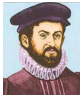
Casiodoro de Reina (impressie op grond van een pover portret dat in Frankfurt hangt).

En in het laatste kwartaal van 2018 (half oktober tot half december) stond er in de universiteit van de Spaanse stad Sevilla een tentoonstelling over de 'Berenbijbel' opgesteld. Daar werd verteld over de samenstelling van de (protestantse) Bijbel. En vooral over leven en werk van Casiodoro de Reina. Deze monnik vluchtte met twaalf geloofsgenoten uit het klooster San